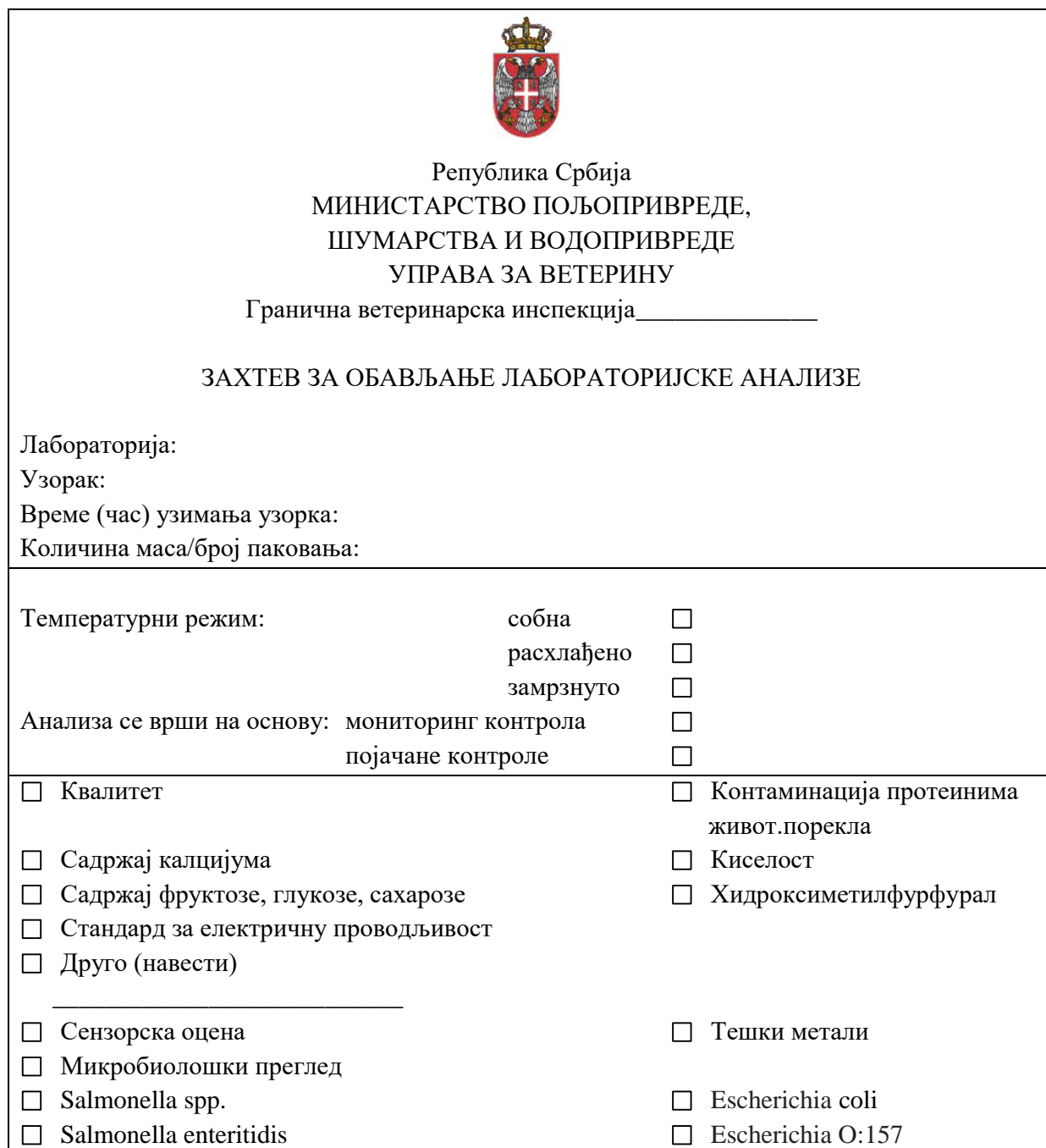
Табела 4 – Захтев за обављање лабораторијске анализе

2) пропратно писмо за пријем узорака у лабораторију, чија је садржина дата у Табели 5 – Пропратно писмо за пријем узорака у лабораторију овог програма.